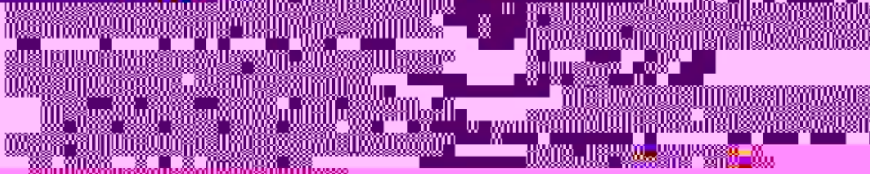
图 1-1-1 标识应用规范